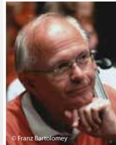
FRANZ BARTOLOMEY VIOLONCELLO