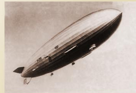
Luftschiff LZ 129 Hindenburg