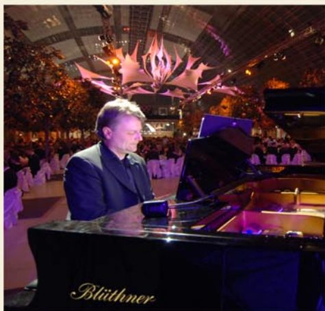
klangvoller Sportler-Ball mit Blüthner