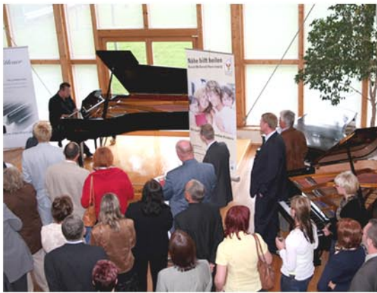
Prinzen-Star begeistert am Blüthner