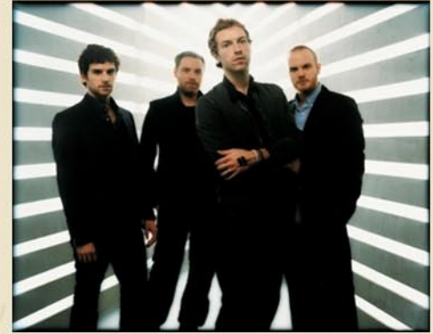
international erfolgreich - Coldplay

Coldplay, eine englische Pop-Rock-Band, besteht aus den Musikern Chris Martin, Jonny Buckland, Will Champion und Guy Berryman, die sich im Jahr 1998 als Studenten am University College London zusammenfanden. Mittlerweile gehören die Musiker zu den weltweit erfolgreichsten Bands des Jahrzehnts. Das aktuelle Album Viva La Vida stand wochenlang an den Spitzen der internationalen Charts. Mit schwebenden Akkorden und leicht melancholischen Rhythmen inszenieren Coldplay die Schönheit der Musik. Sie ist für die Band Ausdruck ihrer Emotionen und Persönlichkeit. Kein Wunder, dass Gitarrist Jonny Buckland für seinen privaten Wohnsitz einen schwarz polierten Salonflügel aus dem deutschen Familienunternehmen im Blüthner Center London am Berkeley Square kaufte.